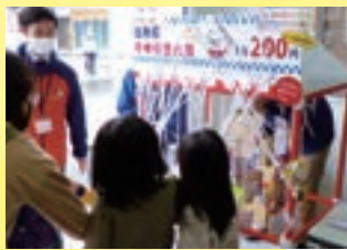
▲千本引き大会の様子

毎回大好評のイベントです。 何が当たるかわからないので、 新たな一品との出会いも あるはず!